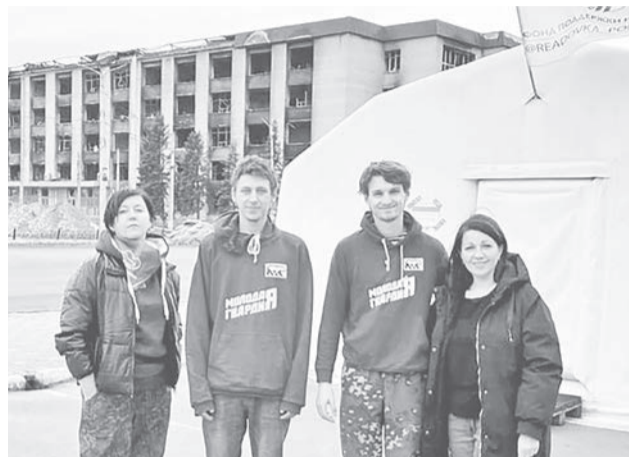
В Северодонецке с ребятами из «Молодой Гвардии».

Встав в колонну с ирбитчанами, тулунцами и серовцами, байкаловская машина зашла в Луганскую народную республику 10 ноября рано утром. Наши ребята с той стороны знали об этом и потихоньку выходили на связь. Преодолевать путь до Старобельска было немного тревожно: большая колонна машин хорошо заметна. Но всё прошло благополучно, кто-то из парней уже ждал нас в условленном месте. Началась разгрузка, помогали все. Нужно было аккуратно выкатить из фур УАЗы, Нивы, мотоциклы, ведь в каждой приехало ни по одной единице техники. Работа продолжалась с утра до вечера, во время разгрузки мы успевали общаться с земляками, расспрашивать об обстановке, рассказывать, что у нас делается дома для