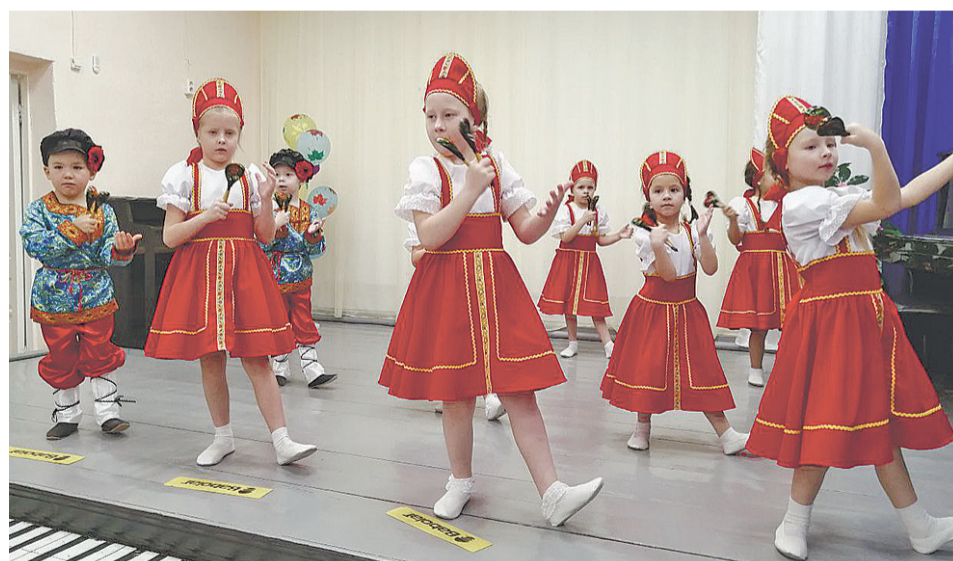
Слаженно прозвучала задорная мелодия «Ой, блины» в исполнении оркестра «Звёздочки» детского сада «Рябинушка».