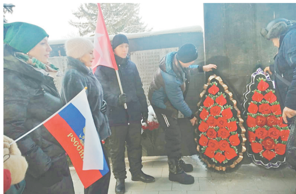
После мероприятия все вместе возложили венки у вечного огня.