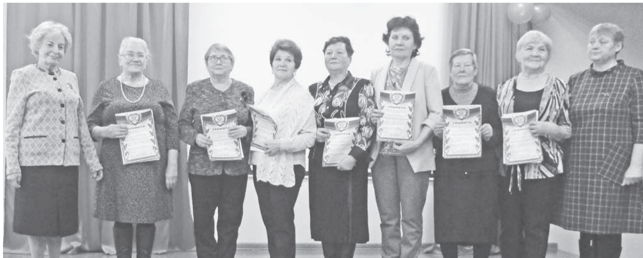
Награды получили руководители лучших первичных организаций ветеранов с. Байкалово.

истории родного учебного заведения, собрав редкие фотографии и иные важные документы для школьного музея.