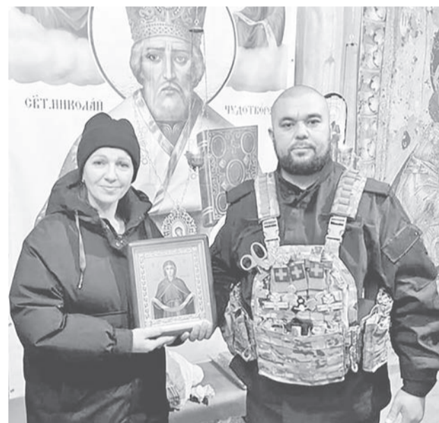
Икона из Байкалово передана в военно-полевой храм.

На сегодняшний день снова закуплены сети, приобретаем ткань и продолжаем вязать столь необходимые маскировки, подстраиваясь под цвета, которые нужны сегодня. Ждём всех желающих помогать в здании администрации района по адресу: с. Байкалово, ул. Революции, 23, на 1 этаже, в здании Комплексного центра социального обслуживания населения (д/с «Рябинушка») по адресу: с. Байкалово, ул. Октябрьская, 40, в Домах культуры сёл и деревень.