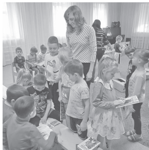
Наши книги доставлены в детские сады Старобельска.