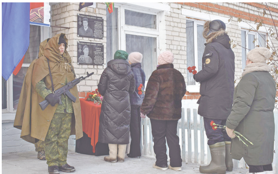
Собравшиеся возложили живые цветы.