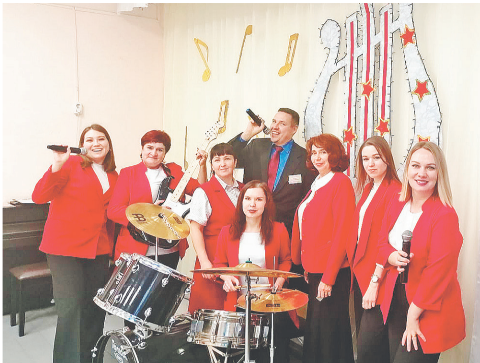
Вокально-инструментальный ансамбль «Птица счастья».

Говорят, зрителя трудно купить – аплодисменты достаются тому, кто много и кропотливо работает, пропуская свои творения через собственное сердце. Так было и на этом концерте! После «Вальса» – музыкальной иллюстрации к повести А. Пушкина «Метель»